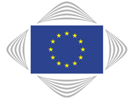
Europees Comité van de Regio's